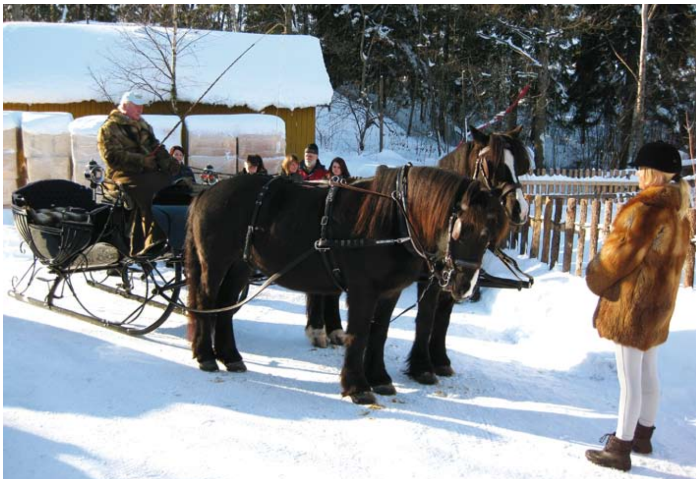
"Finn minst 5 feil"