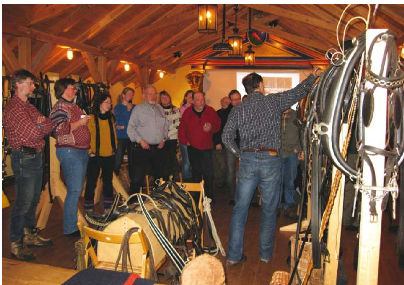
Utstyret kommenteres og forklares.